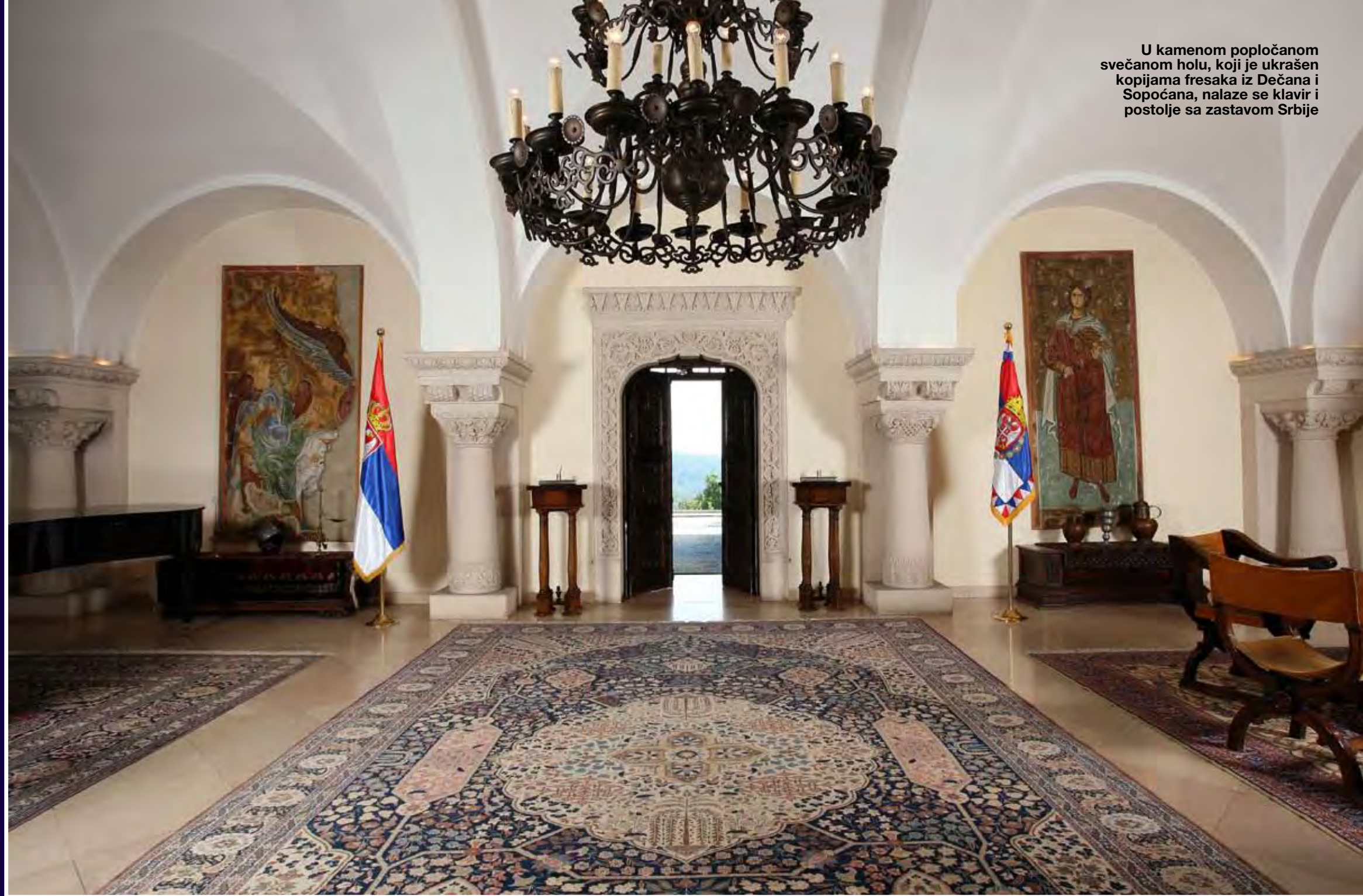
U kamenom popločanom svečanom holu, koji je ukrašen kopijama fresaka iz Dečana i Sopoćana, nalaze se klavir i postolje sa zastavom Srbije

N a najvišoj koti Dedinjskog brega, daleko od očiju znatiželjne javnosti s početka dvadesetog veka Kralj Aleksandar I, ujedinitelj, otkupio je uoči svog venčanja 1922. godine, sa rumunskom princezom Marijom, imanje od sto trideset pet hektara. Narednih pet godina sa puno ljubavi i pažnje gradio je kompleks u kom je, uz voljenu surpugu i sinove, želeo da dočeka mirnu starost. Krupni istorijski događaji srušili su njegove planove - ubijen je u Marseju 1934. Njegov naslednik, Petar II, morao je da napusti zemlju početkom Drugog svetskog rata, i čitav život proveo je u izgnanstvu. Raskoš i komfor koje je tvorac ovog impresivnog zdanja namenio sebi morali su da čekaju treću generaciju: 17. jula 2001. godine na Dvor su se doselili prestolonaslednik Aleksandar II Karađorđević, unuk kralja ujedinitelja, i njegova porodica, supruga Katarina i sinovi Petar, Filip i Aleksandar. Današnji domaćin rođen je u izbeglištvu 1945, u londonskom hotelu Kleridžis , gde su njegovi roditelji stanovali nakon venčanja.