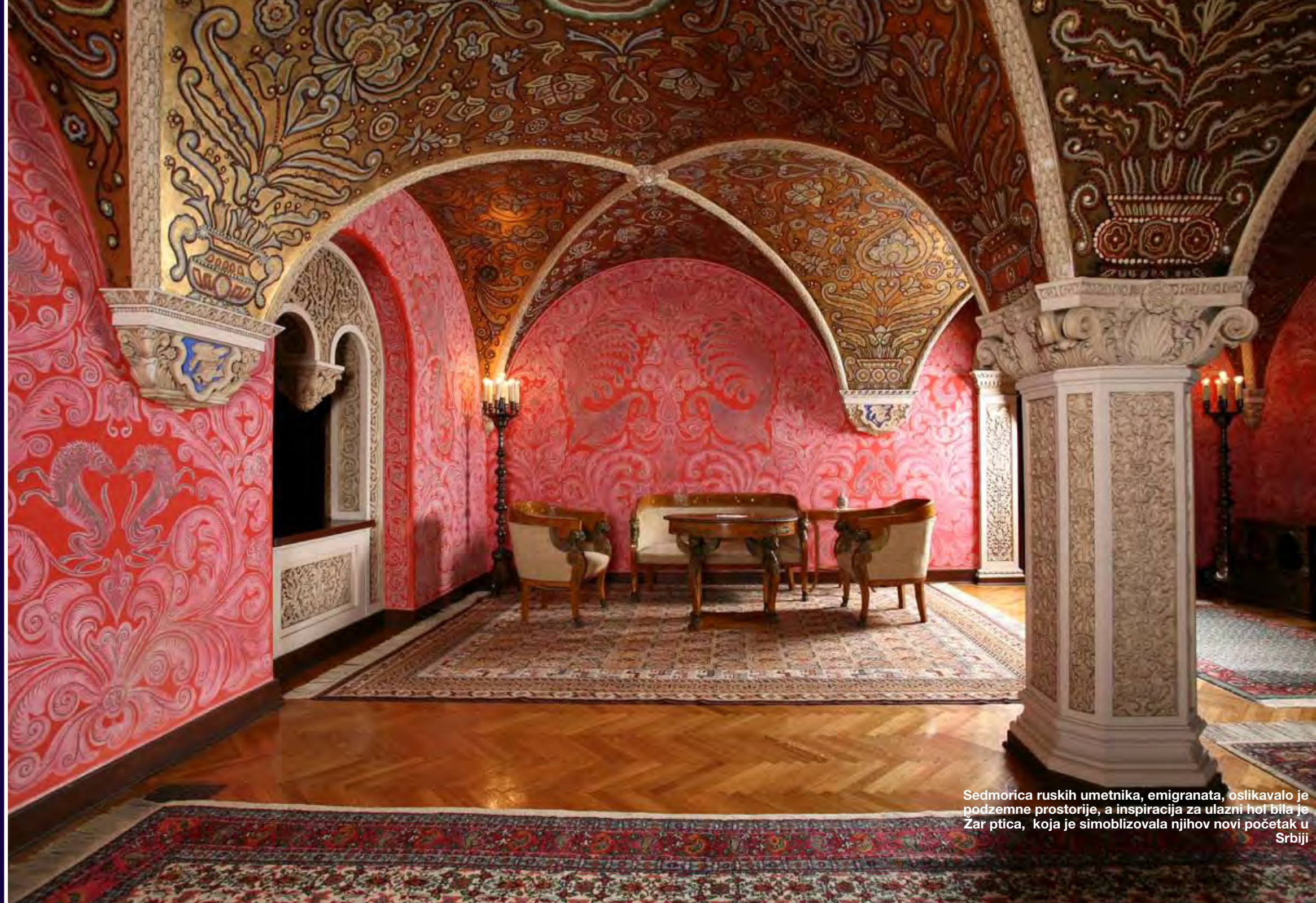
Sedmorica ruskih umetnika, emigranata, oslikavalo je podzemne prostorije, a inspiracija za ulazni hol bila je Zar ptica, koja je simoblizovala njihov novi početak u Srbiji

ružičnjak, a one su omiljeno cveće i princezi Katarini. Čitav niz kaskadnih terasa okružuje dvorove i svaka od njih ima svoju funkciju; neke od njih čak su bile koncertni paviljoni. „Petlova terasa“ je dobila naziv po skulpturi Zdenka Kaline, a druga, na kojoj dominiraju skulpture Ivana Meštrovića, omiljenog vajara Kralja Aleksandra I, je takozvana Obiliceva ili Sfingina . Svaka od njih ima specifičnu atmosferu.