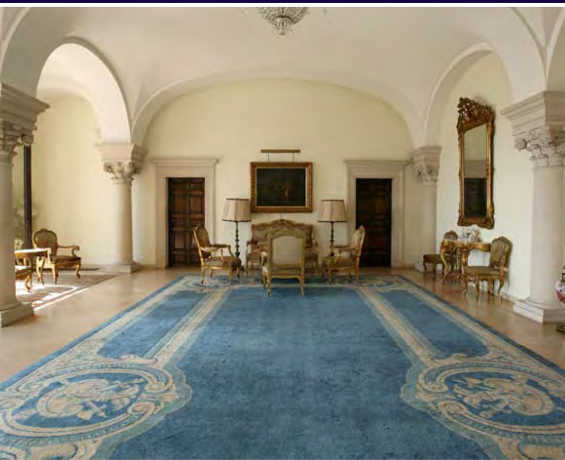
8 Plavi salon je opremljen u baroknom stilu, u njemu je izuzetan primerak rokoko garniture za koju su zainteresovani brojni svetski muzejski kolekcionari