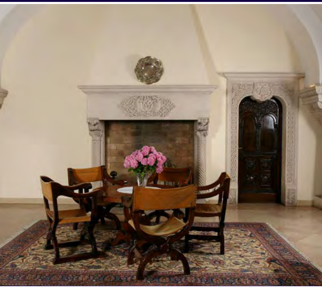
Prostorije u prizemlju su raskošno opremljene, u njima je sto za kojim princeza Katarina ponekad potpisuje dokumenta, a drvena vrata vode ka biblioteci sa kaminom, u kojoj se sada čuvaju raritetne knjige