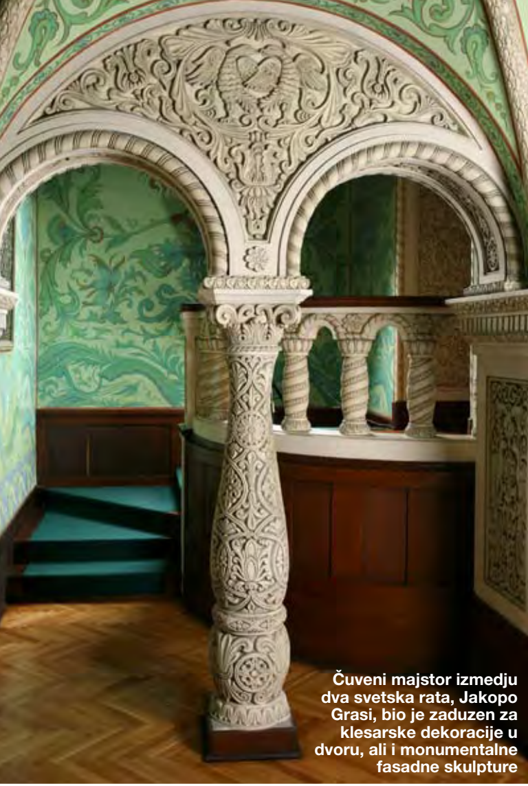
Čuveni majstor između dva svetska rata, Jakopo Grasi, bio je zadužen za klesarske dekoracije u dvoru, ali i monumentalne fasadne skulpture