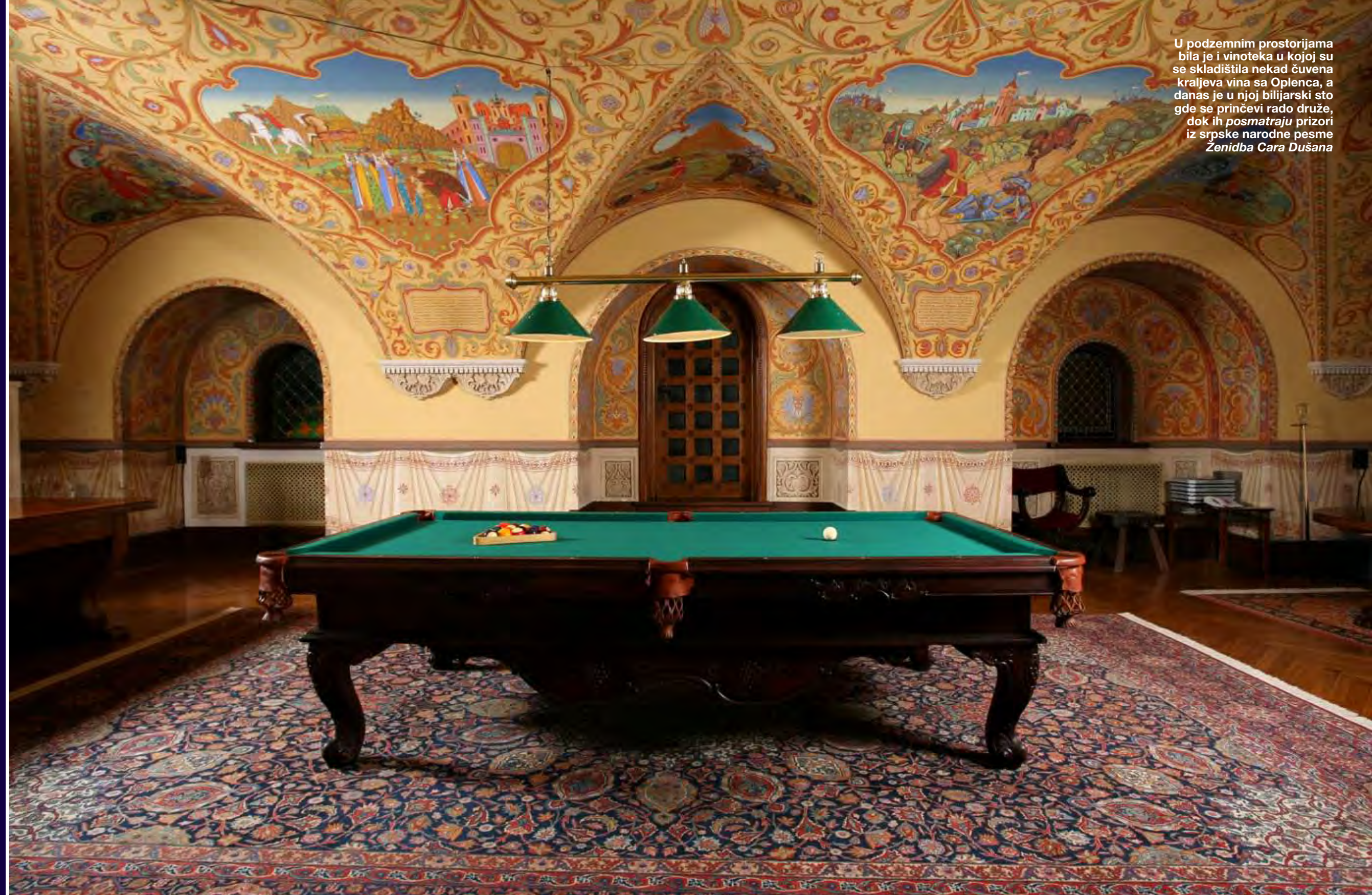
U podzemnim prostorijama bila je i vinoteka u kojoj su se skladištila nekad čuvena kraljeva vina sa Oplenca, a danas je u njoj bilijski sto gde se prinčevi rado druže, dok ih posmatraju prizori iz srpske narodne pesme Zenidba Cara Dušana