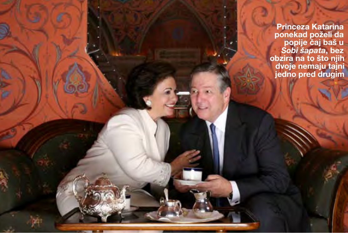
Princeza Katarina ponekad poželi da popije čaj baš u Sobi šapata , bez obzira na to što njih dvoje nemaju tajni jedno pred drugim

'Spremajući se za počinak, shvatili smo da ništa nismo jeli ceo dan, ali nismo mogli da nademo kuhinju. Onda se moj suprug setio da mu je otac pričao kako njegov deda nije voleo miris hrane i da je, kada je gradio dvor, insistirao da se kuhinja sagradi što dalje. Bili smo suviše umorni da bismo je tražili'