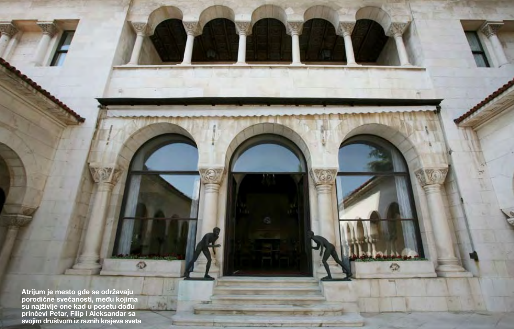
Atrijum je mesto gde se održavaju porodične svečanosti, među kojima su najživlje one kad u posetu dođu prinčevi Petar, Filip i Aleksandar sa svojim društvom iz raznih krajeva sveta