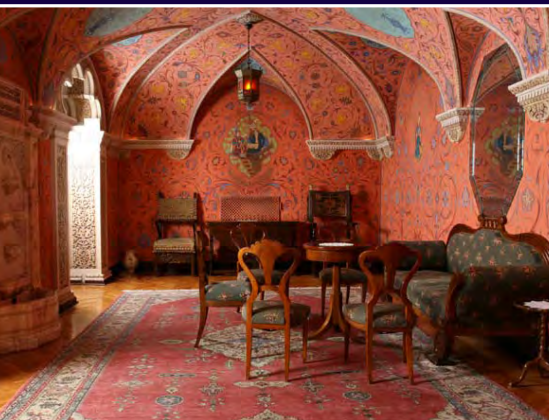
14 Fontana, koja se nalazi u središnjem delu prostorije brižljivo je pozicionirana, a ruski graditelji su sa puno pažnje izračunali intenzitet slapova i šum vode, pa bi zahvaljujući specifičnom obliku svoda, koji je zvuk gurao ka fontani, opasnost od prisluškivanja bila eliminisana

'Spremajući se za počinak, shvatili smo da ništa nismo jeli ceo dan, ali nismo mogli da nademo kuhinju. Onda se moj suprug setio da mu je otac pričao kako njegov deda nije voleo miris hrane i da je, kada je gradio dvor, insistirao da se kuhinja sagradi što dalje. Bili smo suviše umorni da bismo je tražili'