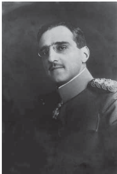
Њ.В. Краљ Александар I

Његово Краљевско Величанство Краљ Александар I Карађорђевић личност је достојна поштовања по способностима, вештини и храбрости коју је показао у Првом и Другом балканском и у Првом светском рату. Он је потомак две славне српске владарске породице: Карађорђевића, који су владали Србијом и Петровића, који су владали Црном Гором. Његово Краљевско Величанство Краљ Александар I је праунук вође Првог српског устанка Војда Карађорђа Петровића, унук српског Кнеза Александра Карађорђевића и син српског Краља Петра I Ослободиоца и Краља Срба, Хрвата и Словенаца. По мајци црногорској Кнегињи Зорки, унук је Књаза (касније Краља) Николе I Петровића Његоша.