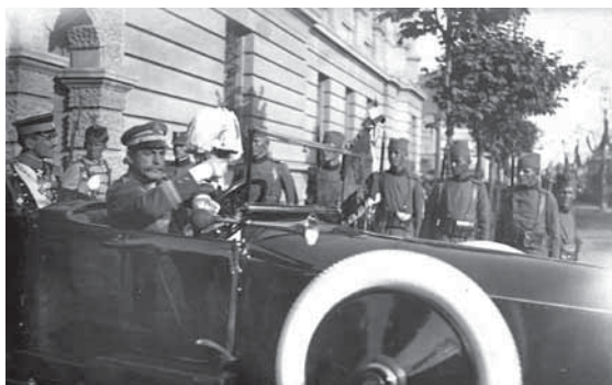
Краљ Александар напушта кућу Крсмановића и одлазак по невесту

су се огласиле фанфаре, поворка се упутила улицама Краља Милана, Коларчевом, Позоришним тргом, Васином, Краљевим тргом, Узун Мирковом и Кнез-Михаиловим венцем у Саборну цркву. Први пут после ослобођења, престоница је добила велики повод за славље. На хиљаде људи дошло је у Београд да би видели „Високе младенце“, које је венчао Његова Светост Патријарх Српски, архиепископ пећки и митрополит београдско-карловачки Димитрије, у присуству митрополита Варнаве скопског, епископа Георгија темиш-