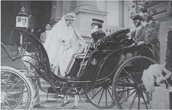
Невеста на путу до Саборне цркве