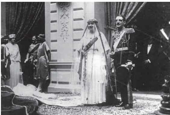
Краљ Александар и Краљица Марија, официјелна фотографија након венчања

Женидбом Краља Александра I ојачан је међународни положај Краљевства Срба, Хрвата и Словенаца, а Династија Карађорђевића уздигла се до угледне европске Владарске Куће. Краљева женидба је такође била значајан политички чин у унутрашњој политици. По 56. члану Видовданског Устава, Краља је наслеђивало мушко потомство из законитог брака по реду прворођења. Тек по рођењу Престолонаследника, обезбеђени су услови за спокојан живот, а Краљ Александар I благословен је са три сина. Престолонаследник Петар (Краљ Петар II) је рођен 6. септембра 1923., Краљевић Томислав 19. јануара 1928., а Краљевић Андреј 28. јуна 1929. године.