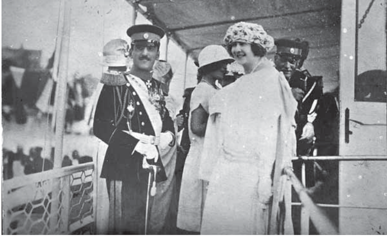
Краљ Александар дочекује своју вереницу Принцезу Марију на београдском пристаништу

пука Румунске Војске. Истог дана су се представници обе Владе, Никола Пашић и Таке Јонеску договорили о подели територије Баната и решили проблем граница између Румуније и Краљевства Срба, Хрвата и Словенаца.