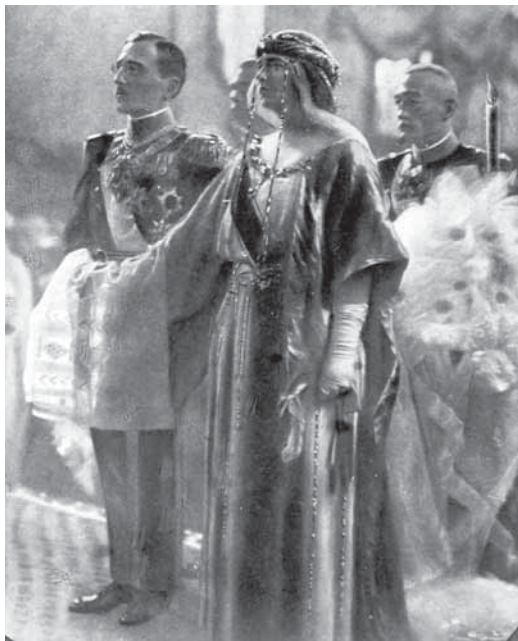
Млада и младожења током церемоније венчања у Саборној цркви

Звона свих цркава у Београду звонила су у знак објаве венчања, заједно са јаком плотунском паљбом са тврђаве и са Дунава. Званичан документ о венчању Краља Александра I и Краљице Марије је Венчаница, калиграфски исписана на белој свили, са уметнички израђеним вишебојним заглављем. Патријарх Димитрије је на Венчаници исписао благослов: