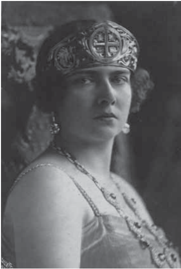
Њ.В. Краљица Марија

пријатељство два савезничка народа са Балкана. Његово Краљевско Величанство Фердинанд, Краљ Румуније и Његово Краљевско Величанство Краљ Александар I, желећи да учврсте вековне везе пријатељства између два народа, одлучили су да сједине две породице брачном везом.