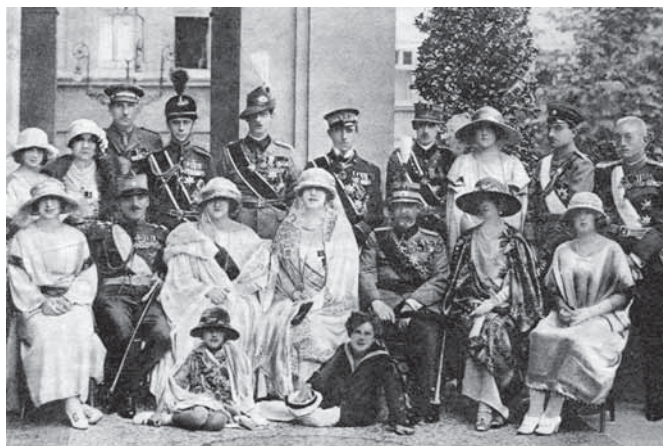
Млада и младожења са члановима породица