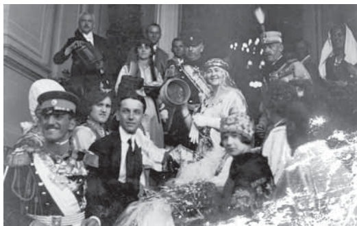
Краљевски младенци примају честитања

Краљевски Пар је отпутовао на медени месец на Блед (Словенија). Краљица Марија одмах је освојила симпатије свих захваљујући својој скромности, једноставности и доброти. Они који су имали прилику да посете Краљевски Пар у Двору на Дедињу, задржали су дивну успомену на њену топлину и шарм.